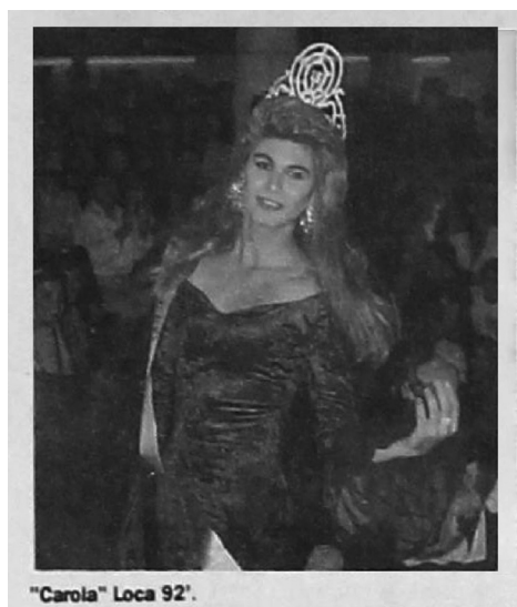
"Carola" Loca 92, en: La Crónica , 22 de octubre, 1993..