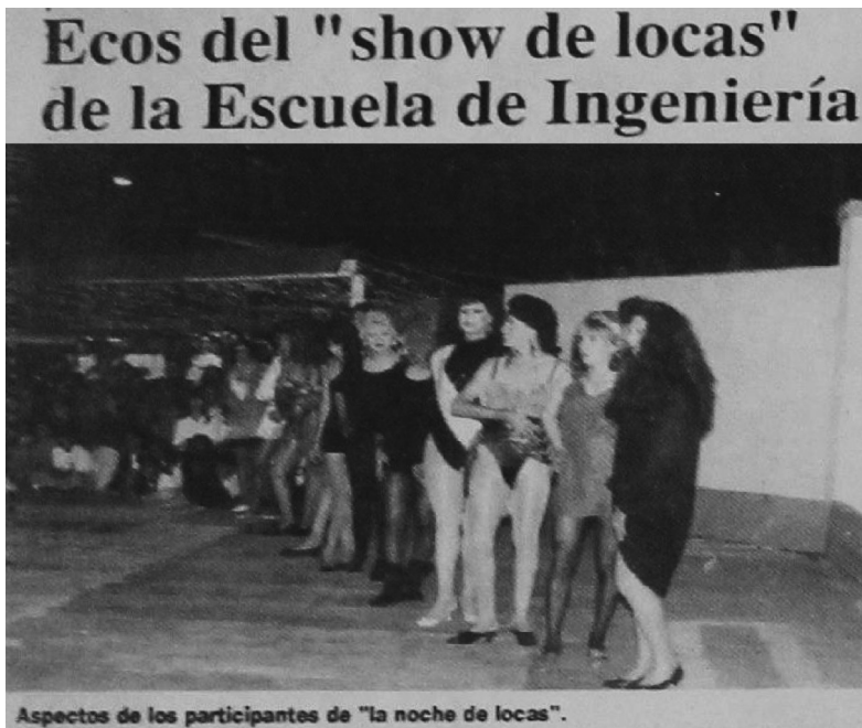
"Ecos de la noche de locas de la Escuela de Ingeniería", en: La Crónica , 1 de noviembre, 1992